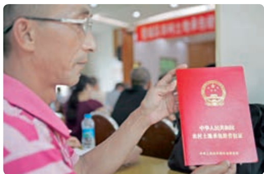
农民领取农村土地承包经营权证