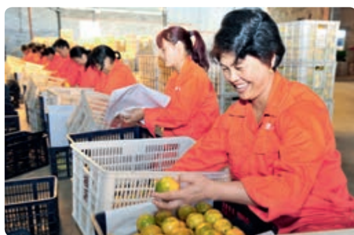
农民专业合作社果品加工线