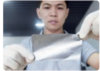
高导热超柔性石墨烯膜