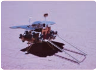
天问一号火星探测器

面对全球新一轮科技革命和产业变革重大机遇，我国要进一步聚焦新一代信息技术、生物技术、新能源、新材料、高端装备、新能源汽车、绿色环保以及航空航天、海洋装备等战略性新兴产业，加快关键核心技术创新应用，增强要素保障能力，培育壮大产业发展新动能。