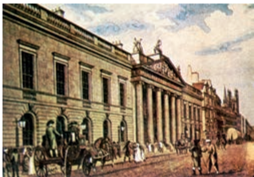
英国东印度公司在伦敦的总部大楼

18世纪中期，英国击败在印度的最大殖民竞争对手法国。19世纪初期，英国东印度公司已经统治了印度的大部分地区。1757—1815年，英国东印度公司从印度直接掠夺的财富约达10亿英镑。同时，英国东印度公司还向中国贩卖鸦片。印度民族大起义爆发后，英国政府取消了英国东印度公司对印度的统治权，英国政府直接统治印度。1858年，英国东印度公司被撤销。