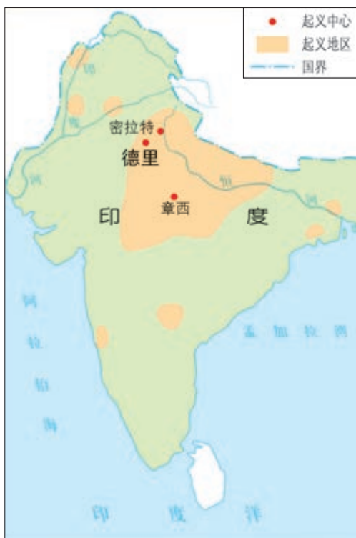
印度民族大起义形势图

1857年，印度土兵首先起来反抗英国殖民者，农民、手工业者以及一些被剥夺了权力的印度王公也参加起义，起义浪潮席卷了印度北部和中部。起义军夺取了德里。英军虽然武器先进，但还是用了几个月的时间才攻陷德里。英军乘势进攻章西，年轻的章西女王领导军民与英军展开激战。章西失陷后，她率军转战外地。战斗中，她身先士卒，直到壮烈牺牲。