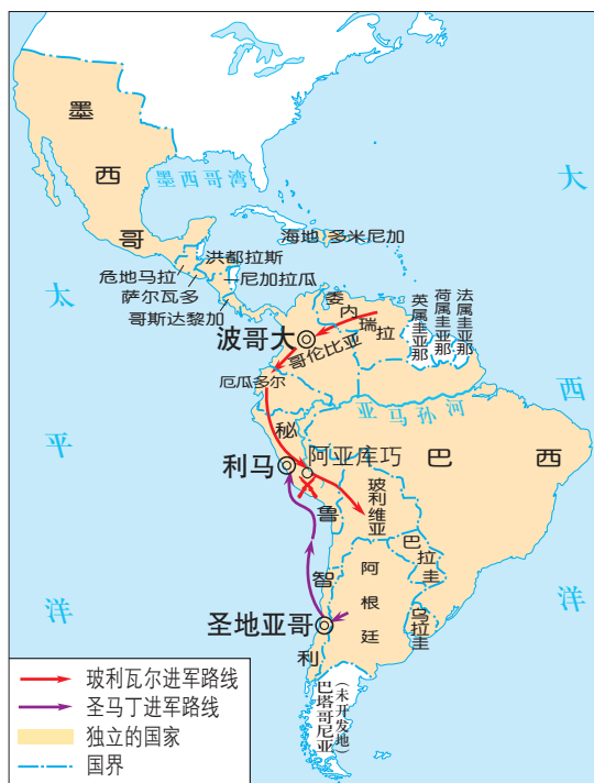
拉丁美洲独立运动形势图

在南美洲北部地区，玻利瓦尔宣布解放黑人奴隶，承诺胜利后分给起义士兵土地。大批印第安人、黑人和混血种人参加起义部队。1819年，玻利瓦尔率领队伍，克服艰难险阻，越过常年积雪的安第斯山脉，打败西班牙军队。玻利瓦尔解放了哥伦比亚、委内瑞拉和厄瓜多尔等地，成立了“大哥伦比亚共和国”。当选总统后，他继续领导南美洲的独立运动。在南美洲南部地区，圣马丁领导了阿根廷、智利和秘鲁的独立运动。他和玻利瓦尔被誉为南美的“解放者”。