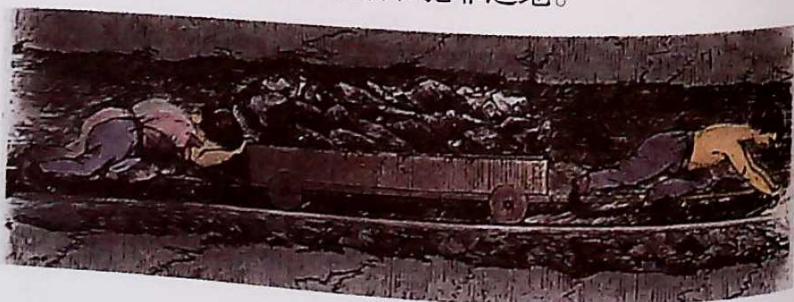
► 在英国煤矿中做工的童工（绘画作品）

当时工人的劳动条件相当恶劣，厂房狭小简陋，被污染的空气几乎使人窒息，工伤事故频频发生。工人尽管每天工作长达十几个小时，但工资微薄，并时时面临失业的威胁。大机器的采用也把妇女和儿童卷进劳动力市场，他们的境况更为悲惨。工人的住宅区是大城市和工业区的贫民窟，街道狭窄拥挤，房屋低矮破旧，天空浓烟密布，地下污水横流，成了贫穷、疾病和犯罪之地。