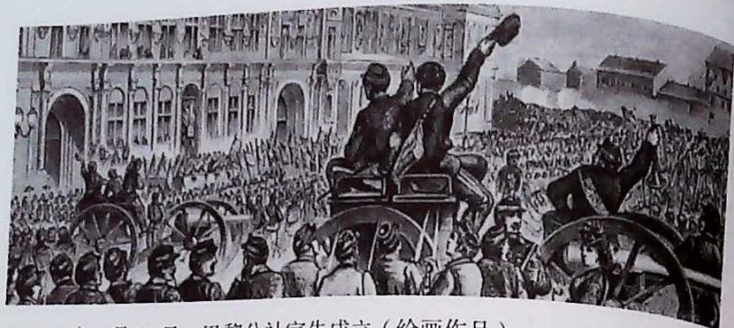
▲ 1871年3月28日，巴黎公社宣告成立（绘画作品）

巴黎公社采取了一系列革命措施：打碎旧的国家机器，建立立法与行政合一的政权机关和司法机构；废除旧军队和旧警察，代之以国民自卫军和治安委员会；人民有权监督和罢免由选举产生的公职人员，所有公职人员的工资不得超过熟练工人的工资；由工人合作社管理工厂；实行八小时工作日；等等。