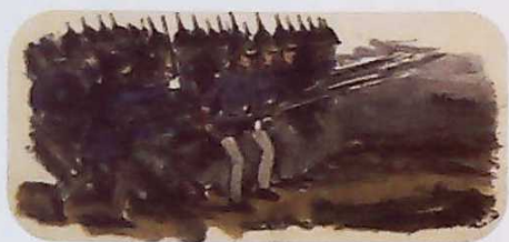
▲ 统治者派兵镇压西里西亚织工起义 (绘画作品)

1844年6月4日，德意志西里西亚纺织工人高唱革命歌曲，举行游行示威，示威活动很快发展为起义。起义工人捣毁工厂，焚烧债券，队伍很快发展到3000多人，后来起义被镇压。这幅图反映的是统治者镇压工人起义的情景。