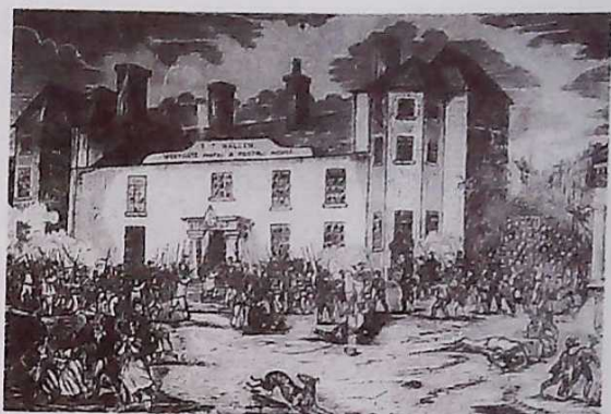
▲ 宪章运动（绘画作品）

为了改善劳动条件和生活状况，维护自己的权益，工人阶级进行了从捣毁机器到争取政治权利的多种形式的斗争。19世纪三四十年代爆发的法国里昂工人武装起义、英国工人争取普选权的宪章运动和德意志西里西亚织工起义，表明工人阶级开始作为独立的政治力量登上历史舞台。工人阶级迫切需要科学理论的指导。