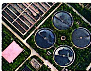
城市生产生活污水处理厂

发展壮大国有经济，要深化国资国企改革。以解放和发展社会生产力为标准，以提高国有资本效率、增强国有企业活力为中心，全面推进依法治企，坚持党对国有企业的全面领导，推动国有资本和国有企业做强做优做大，不断增强国有经济竞争力、创新力、控制力、影响力、抗风险能力。