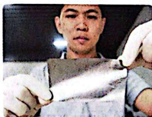
高导热超柔性石墨烯膜