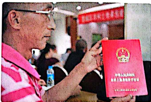
农民领取农村土地承包经营权证