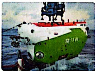
“奋斗者”号全海深载人潜水器