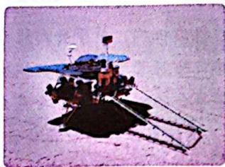
天问一号火星探测器

面对全球新一轮科技革命和产业变革重大机遇，我国要推动战略性新兴产业融合集群发展，构建新一代信息技术、人工智能、生物技术、新能源、新材料、高端装备、绿色环保等一批新的增长引擎。