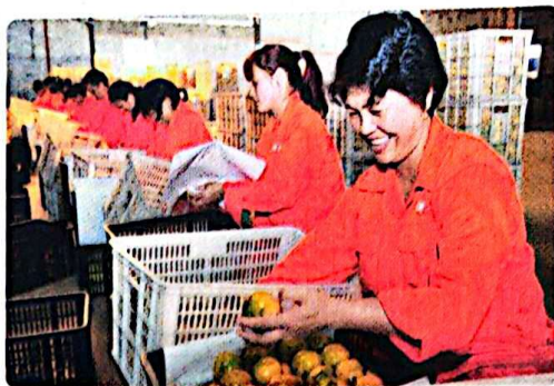
农民专业合作社果品加工线