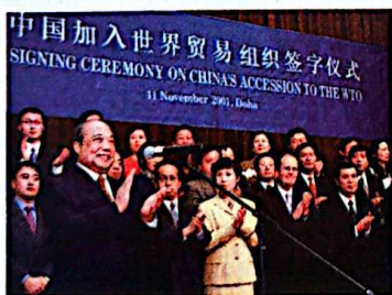
当地时间2001年11月11日，中国加入世界贸易组织签字仪式在卡塔尔首都多哈举行。图为签字后大家鼓掌祝贺。