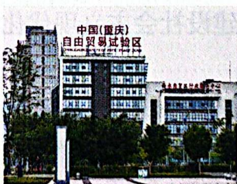
2013年9月起，国务院先后批复成立多个自由贸易试验区。图为中国（重庆）自由贸易试验区。