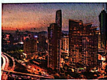
1980年8月26日，深圳经济特区正式设立。经过多年发展，深圳已经成为国际化大都市。图为现在的深圳经济特区。

党的十一届三中全会以来，我国经济发展是在开放条件下取得的，未来我国经济实现高质量发展也必须在更加开放的条件下进行。从兴办深圳等经济特区、沿海沿边沿江沿线和内陆中心城市对外开放到加入世界贸易组织、共建“一带一路”、设立自由贸易试验区、稳步推进中国特色自由贸易港建设、成功举办中国国际进口博览会，这表明中国开放的大门不会关闭，只会越开越大。