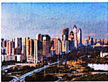
1988年4月13日，七届全国人大一次会议正式批准建立海南经济特区。图为现在的海南省海口市。