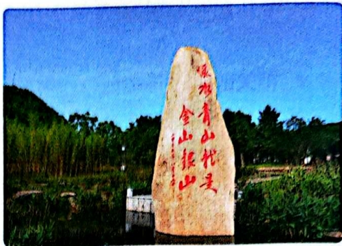
绿水青山就是金山银山

如今,该村青山环绕,漫山翠竹,小溪潺潺,鸟语花香,实现了从“卖资源”到“卖风景”的转变,逐步形成了集旅游观光、河道漂流、户外拓展、果蔬采摘、农事体验于一体的休闲旅游产业链,走出了一条产业兴、生态美、百姓富的可持续发展路子。