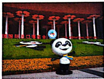
2018年11月5日，首届中国国际进口博览会在国家会展中心（上海）举办。图为首届中国国际进口博览会会场和吉祥物“进宝”。