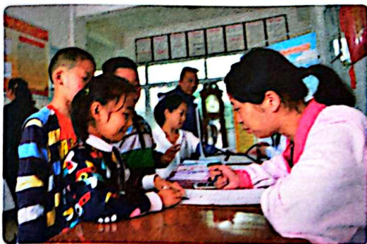
社区卫生服务中心为留守儿童建立健康档案

◆ 社区服务是在政府指导下，以社区组织为依托，在城乡一定层次的社区内以全体社区居民为对象，以特殊群体为重点，运用灵活多样的形式向他们提供福利性服务的一种社会化保障机制。