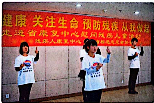
关心残疾儿童健康行动

社会优抚是国家和社会依法对现役军人、复员退伍军人以及军烈属等优抚对象实行物质照顾、生活和工作安置、精神抚慰的褒扬性、补偿性、优待性、综合性的特殊社会保障。