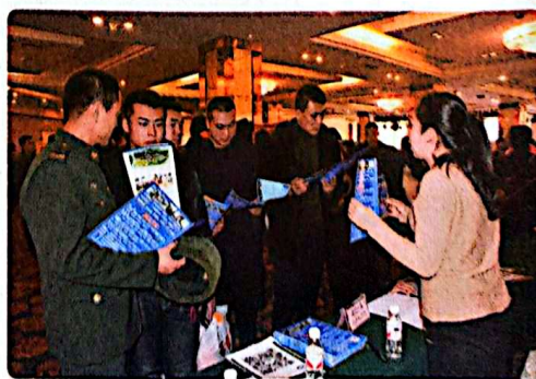
举办退伍军人岗前培训