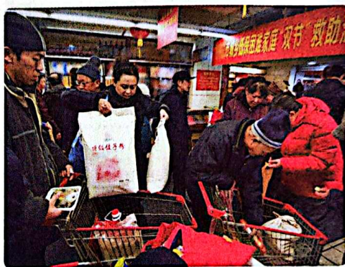
享受最低生活保障的家庭免费选取生活用品

社会福利是政府和社会向老年人、残疾人、妇女、儿童和其他社会成员提供的社会化服务、实物供给或者福利津贴,以满足社会成员的生活需要并促使其生活质量不断得到改善和提高,是最高层次的社会保障。