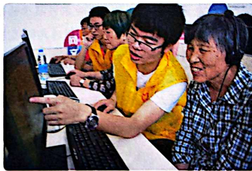
社区开办“银发网络课堂”

社会保险是我国社会保障体系的核心。它通过政府、单位、个人三方共同筹集资金，保障公民在年老、疾病、工伤、失业、生育等情况下依法从国家和社会获得物质帮助。在我国，社会保险主要包括基本养老保险、基本医疗保险、工伤保险、失业保险、生育保险等。