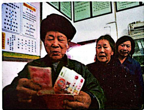
低收入群众领取最低生活保障金

最低生活保障是社会救助的主要内容之一,是国家对家庭人均收入低于当地政府划定的最低生活标准,且符合当地最低生活保障家庭财产状况规定的家庭,给予一定现金和物资资助,以保障该家庭成员基本生活所需。1997年,我国开始在全国范围内建立最低生活保障制度。