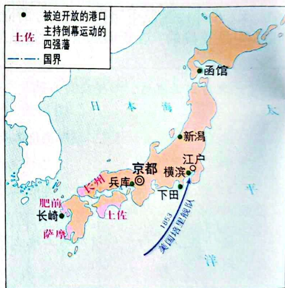
明治维新前的日本