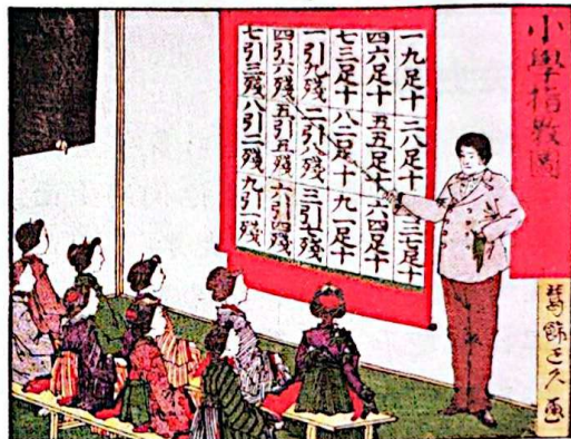
明治维新时期的课堂

1868年3月，日本新政府颁布了《五条誓文》，内容包括：一、广兴会议，万事决于公论；二、上下一心，盛行经纶；三、官武一体，以至庶民，各遂其志，毋使人心倦怠；四、破除旧来之陋习，一本天地之公道；五、求知识于世界，大振皇国之基础。《五条誓文》表明了日本改革旧制度、向西方学习的决心，成为明治维新的政治纲领。