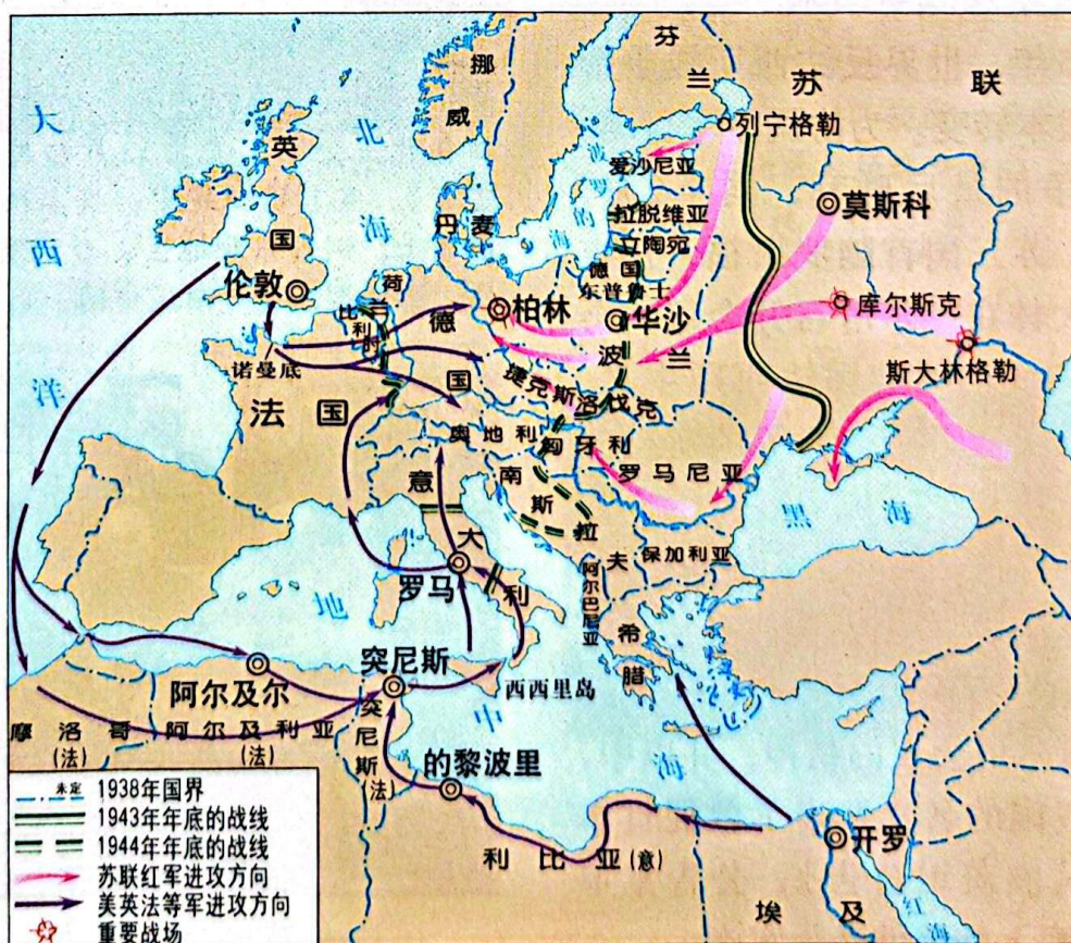
1943—1945年的欧洲、北非战场示意图

1942年，为了压制美国海军力量，加强在太平洋地区的海上军事地位，日本决定进攻美国太平洋舰队的重要基地中途岛。美军事先了解了日军的作战计划，伺机反击。日军损失惨重，元气大伤，再也无力在太平洋地区发动大规模进攻。