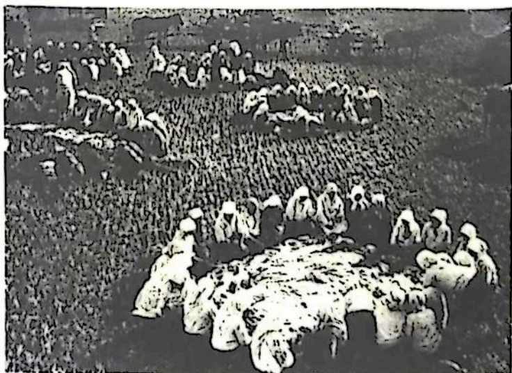
集体农庄庄员在田间用餐

斯大林认为，为了实现社会主义工业化，农民必须要作出牺牲。农业集体化就是把农民的土地和其他主要生产资料公有化。在农业集体化的浪潮中，新经济政策被终止，农民都要加入集体农庄。农民的住宅、家禽、小家畜等一律公有化。在农业集体化过程中，农民的利益受到严重损害，致使苏联农业生产长期停滞。