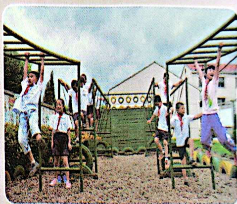
我们的课间活动活泼又安全。