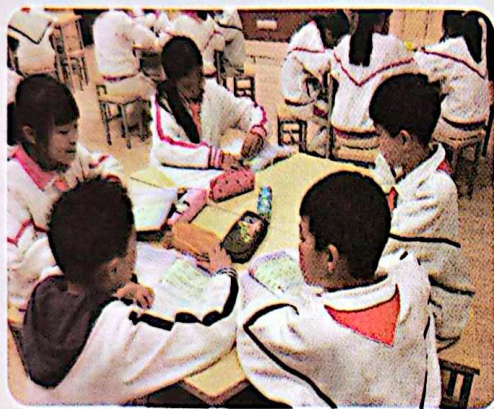
我们的课堂学习有序又活跃。

没有规矩，不成方圆。国有国法，校有校纪，班有班规。班规是班级共同生活的规则。班规可以让班级生活健康有序，使同学们在班里能愉快、安全地学习和活动。