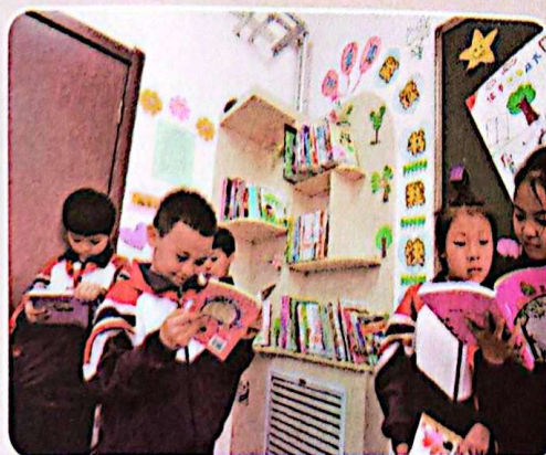
借阅图书时，我们都会做到爱护图书，看完后放回原位。